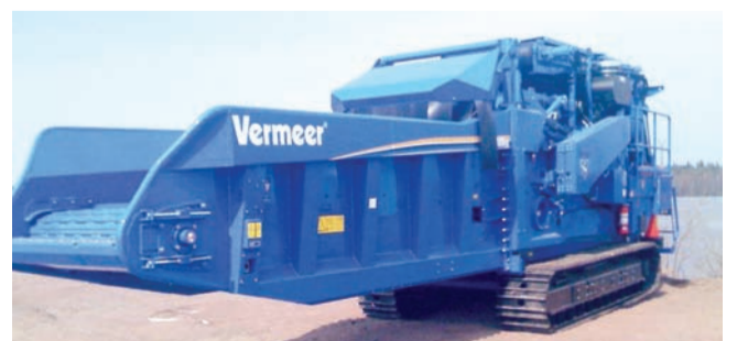
JH-Kuljetus Oy:llä on käytössä myös uusi tela-alustainen Vermeer HG6000TX -vaakatasomurskain, erikoisväreissä sekini.