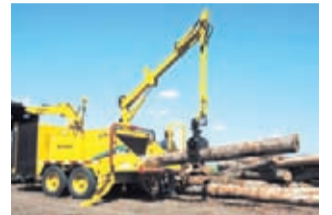
Vermeer tarjoaa kattavan ja laadukkaan hakkurimalliston erilaisiin puun haketustarpeisiin.

- TG7000 on nyt saatavilla alle 3,5 m kokonaisleveydellä mikä mahdollistaa sen kuljettamisen tiellä ilman saattoautoa, sanoo Wegelius.