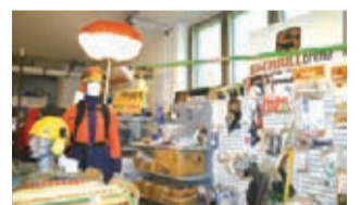
Several Oy:n myymälässä Helsingin Takkatiellä on tarjolla laaja valikoima arboristivarusteita.