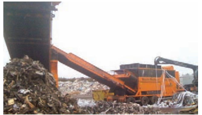
Kajaanilaisella Huurinainen Oy:llä on käytössä kaksi Several Oy:n maahantuoamaa tanskalaista M&J hidasta esimurskainta.

- 630 hv moottorilla varustettu HG6000 on tosi monipuolinen kone mikä minimoi kulut ja maksimoi murskatun materiaalin tuoton. Asiakkaamme ovat