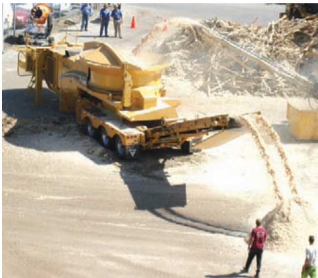
Vermeer TG7000 -kaukalomurskaimella saadaan tuotettua rakennusjätepuusta suoraan raaka-ainetta pellettien valmistukseen.

niin että kun jotain tapahtuu niin kone saadaan mahdollisimman nopeasti huollettua ja takaisin tuottavaan työhön. Esimerkiksi Duplex Drum -rumpu on todella nopea huoltaa mm. terien osalta ja seulat vaihtuvat viidessä minuutissa, kertoo myyntijohtaja Christopher Wegelius.