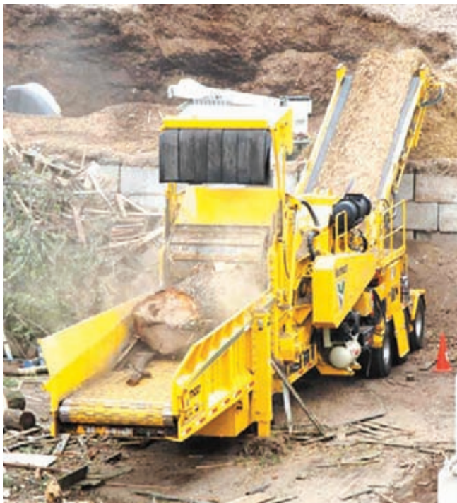
Järeä Vermeer HG8000 -vaakatasomurskain on varustettu 1000 hv moottorilla ja siinä on maailman suurin rumpu, syöttöaukko, syöttöpöytä ja ulosmenohihna.