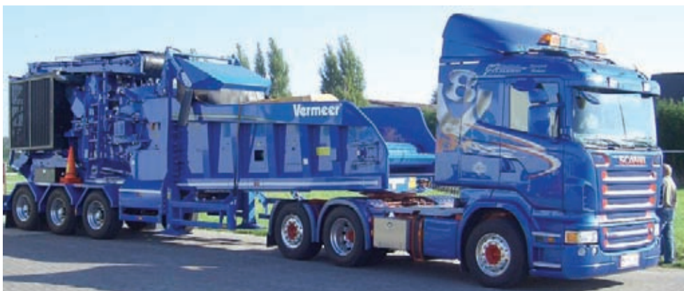
JH-Kuljetus Oy Seinäjoelta hankki keväällä 2009 Vermeer HG6000 -vaakatasomurskaimen erikoisvärissä vetoauton värin mukaan. Myös parkanolainen Alaku Oy on hankkinut uuden HG6000 -vaakatasomurskaimen.