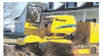
Tehokkaita Vermeer kantojyrsimiä on käytössä Suomessa jo yli 150 kappaletta.