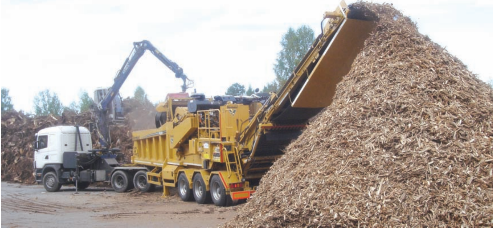
Vermeer HG6000 -vaakatasomurskain on todella tehokas valinta energiapuun kuten kantojen ja korjuutähteiden murskaukseen.

S everal Oy on helsinkiläinen vuonna 1993 perustettu konealan maahantuoja, jonka perustoimintaan kuuluvat maanrakennus- ja ympäristöalan koneet, maatalouteen ja puutarhan- sekä metsänhoitoon liittyvät laitteet ja varusteet sekä timanttiteräiset työkalut ja erilaiset raskaat koneet.