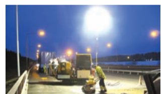
Several Oy maahantuo lisäksi mm. pallotyövalaisimet sekä infra-puna kohdelämmittimet.