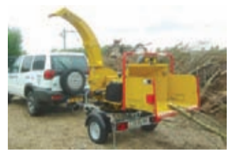
Kevyimmät hakkurit kulkevat kätevästi pieninkin henkilöauton perässä työkohteeseen.